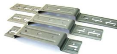
Bride de fixare